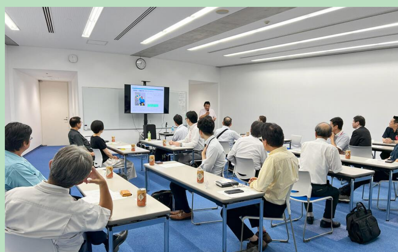
気軽な交流を支援するランチ交流会「てくがランチ（毎月開催）」