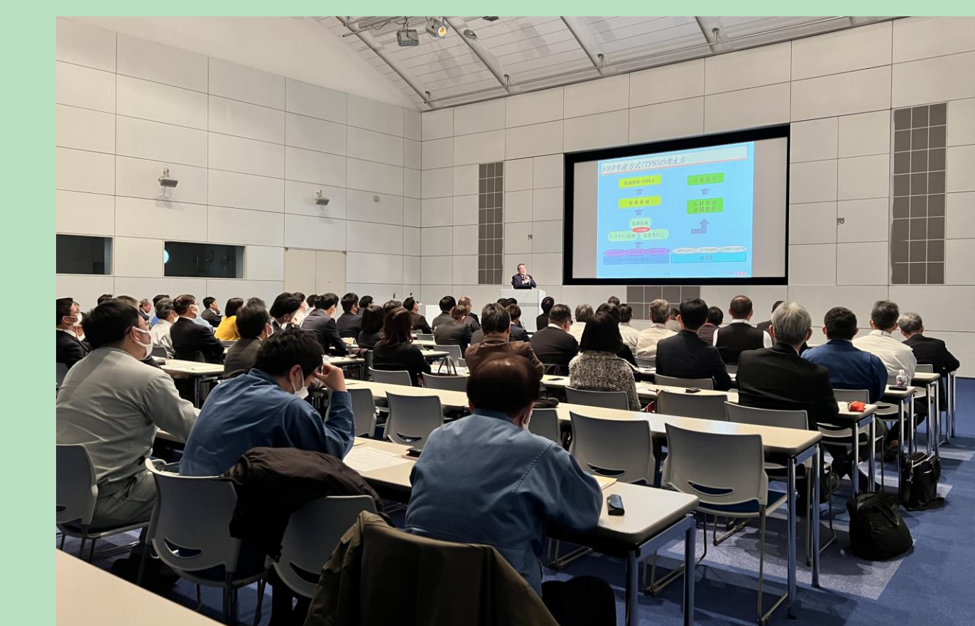
企業間交流を支援する「テクノプラザ・カンパニーズ・ライアンス」